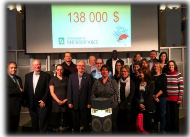
Bravo aux employés et bénévoles de l'Université de Sherbrooke