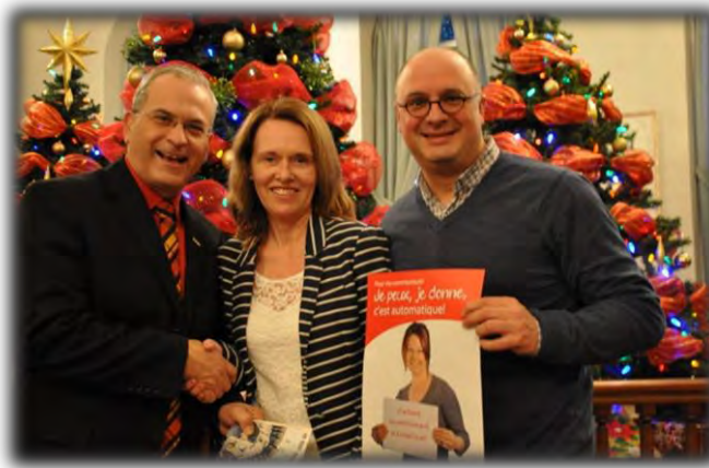
Campagne réussie à la ville de Sherbrooke